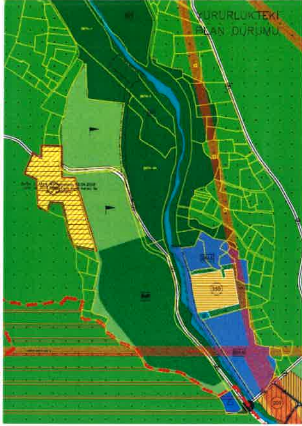
Mevcut 1/5000 Ölçekli NİP