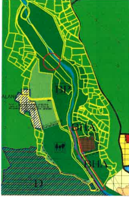
Mevcut 1/25000 Ölçekli NİP